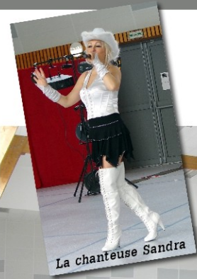
La chanteuse Sandra